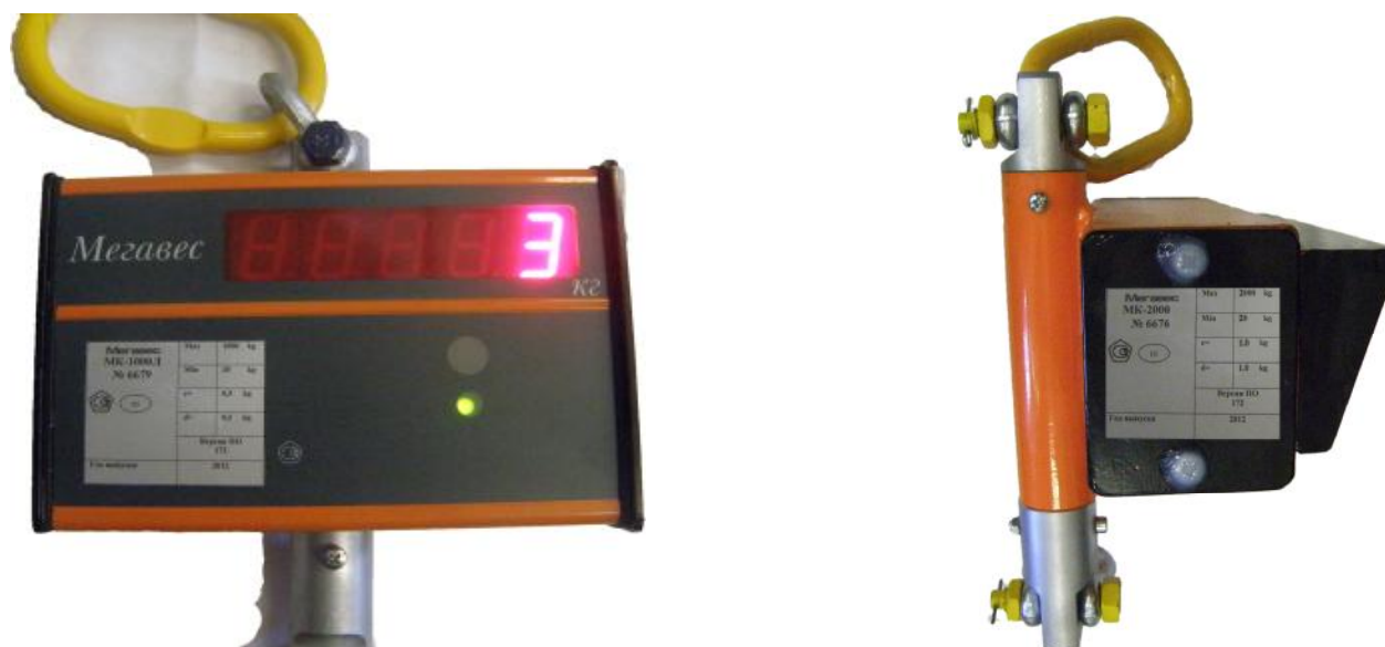
Маркировка весов электронных крановых МК-ХЛ Маркировка весов электронных МК-ХС Рисунок 2 Маркировка весов электронных крановых МК